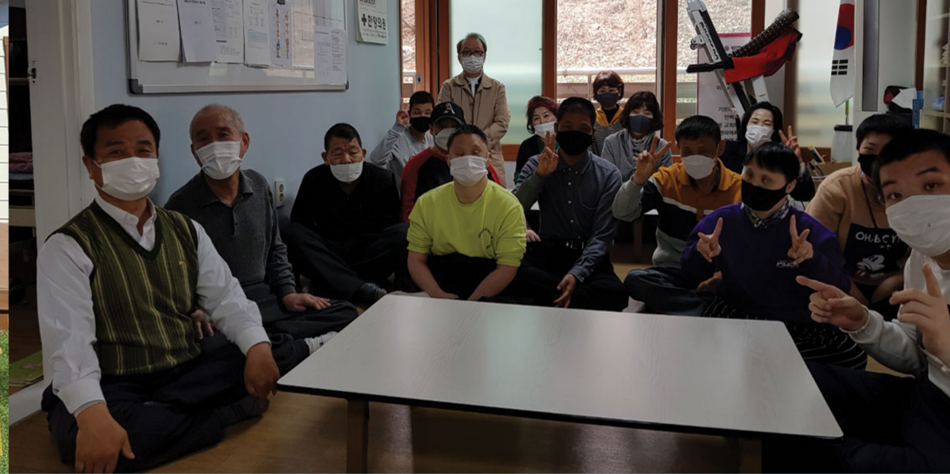
다사랑 마을 (장애우 시설)

감사합니다. 소망의샘터! 2021년 부활절을 맞아 다시 귀한 만남을 갖게되어 감사합니다. 메말랐던 산하에 꽃이피고 새싹이 돋고 다시 살아나는 계절에 다사랑을 격려하시고 후원하시는 소망의샘터 여러선생님들과 후원자님들 그리고 회장님을 뵙게되어 감격입니다. 코로나로 인해 찾아주는이도 후원도 없는 힘겨운 시절을 이겨나가도록 기도해 주시고 정성을 모아주시는 그 정성 그 사랑에 감사합니다. 다사랑식구들이 건강히 안전하게 지내도록 지속적인 기도와 사랑을 부탁드립니다. 고맙습니다. 내내 번성하십시오.