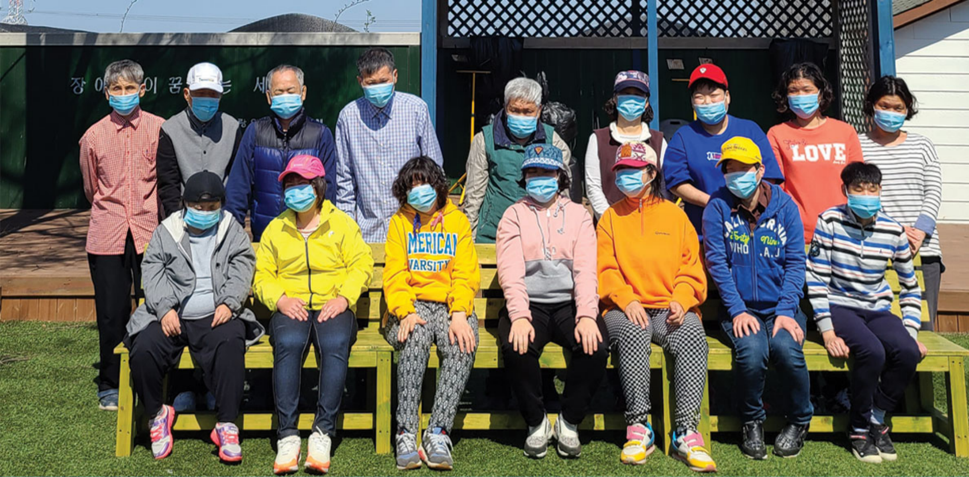
사랑의집 에덴 (장애우 시설)

이제 4월이 시작되었습니다. 엇그제 같았던 겨울을 지나 기온도 따뜻해지고 꽃들도 형형색색 아름답게 활짝 피고, 살랑살랑 봄바람이 너무 좋습니다. 여전히 사회적 거리 두기 등으로 외부의 출입이 불가하여 답답하지만, 에덴에 있는 텃밭이나 근처에 있는 푸르른 나무들을 보며 애써 기분전환을 하고 있습니다. 식구중에 텃밭에 상추를 심고 싶다고 출라 모종을 사러 나갔다가 다른 급한일정이 생겨 보기만 하고 돌아와야 해서 아쉬운 마음으로 발길을 돌렸습니다. 마음 같아선 식구들과 이곳저곳 돌아다니며 봄을 맘껏하고 싶은데... 아쉬운 마음만 크네요. 이제 자유롭게 돌아다닐 날이 머지 않았기를 바래 보며... 보고픈 소망의 샘터 회장님, 선생님, 후원자님들 모두 힘든 시기를 잘 버텨내시길 간절히 기원합니다. 화사한 이 봄날에.. 나들이는 꿈도 못 꾸지만 바람도 살랑살랑 하늘도 맑고, 덤지도 춥지도 않은 햇살 좋은 날 나들이 나온것 처럼 기분내며 운동장에서 사진을 찍어 보았습니다. 다들 예쁘고 멋있지요?..^^ 코로나로 인해 많이 힘든 요즘 다같이 힘내보아요~~!! 샘터지기님들과 함께 한 시간들을 기억하며... 빨리 만날 수 있기를 간절히 소망합니다. 모든 선생님들 그리고 후원자님들 건강하세요.~~^^